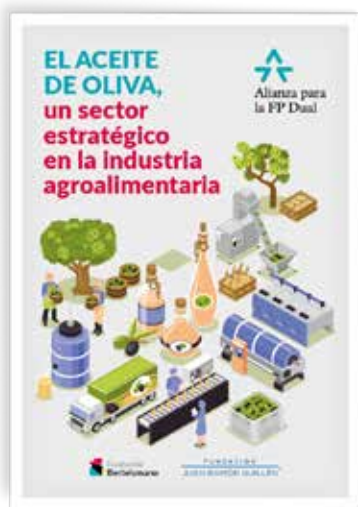
Folleto: El aceite de oliva, un sector estratégico < https://www.fundacion-jrguillen.com/Folleto_Aceite_FJRG.pdf >.

El folleto se ha remitido a los 332 centros de educación secundaria de Andalucía con oferta de FP dual, a centros de educación secundaria de las comunidades de Madrid y Cataluña y a los 59 centros de FP de España con oferta formativa de la familia profesional de Industrias Alimentarias. En total se ha puesto a disposición de aproximadamente 800 centros educativos.