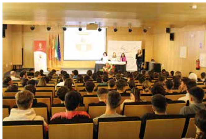
Sesión informativa para alumnado de secundaria de los centros educativos de Dos Hermanas.